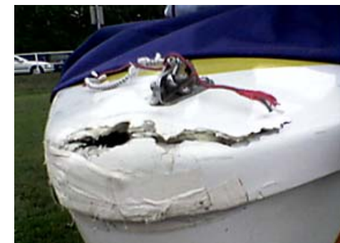
„Werner“ nach der Regatta